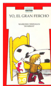
YO, EL GRAN FERCHO