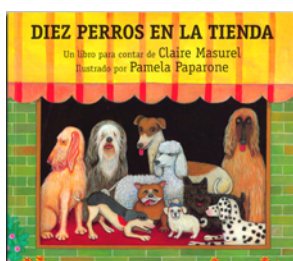
DIEZ PERROS EN LA TIENDA

¿COMO ORDENAN SUS HABITACIONES LOS DINOSAURIOS?