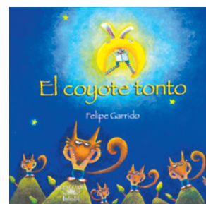
EL COYOTE TONTO