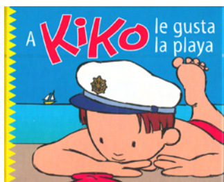
A KIKO LE GUSTA LA PLAYA

¿COMO ORDENAN SUS HABITACIONES LOS DINOSAURIOS?