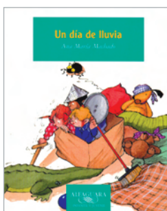
UN DIA DE LLUVIA